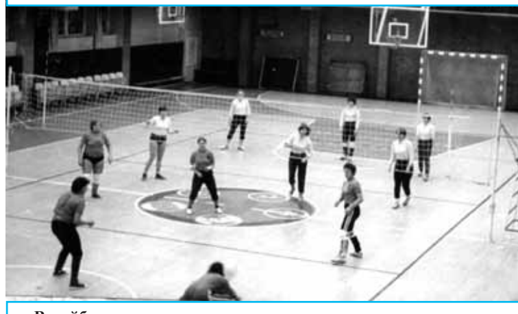
Волейбольные соревнования женских команд.