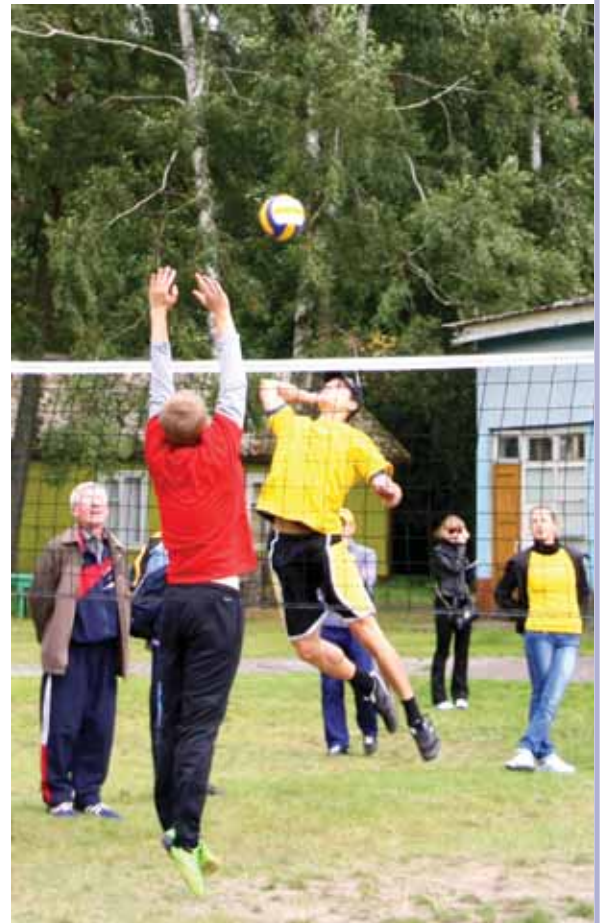
Соревнования по волейболу. Спартакиада 2012 года.

Ведя отчет от I спартакиады, весны 1983 года, 8 сентября 2012 года заводчане провели XVIII спартакиаду. На основании многолетнего опыта проведения подобных соревнований следует сделать однозначный вывод: высокий результат и успех каждой команды на 49,5% зависят от организации и воспитательно-разъяснительной работы, а на 49,5% – от спортивной кондиции и уровня физической подготовки членов команды. И лишь 1% можно списать на «предвзятое судейство», погодные условия, качество питания, расположение звезд на небе и прочие околоспортивные причины. Руководителям подразделений и капитанам команд следует