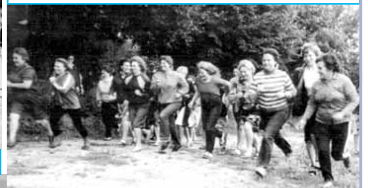
На старте – женщины.