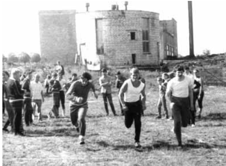
Мужской забег на 100 метров.