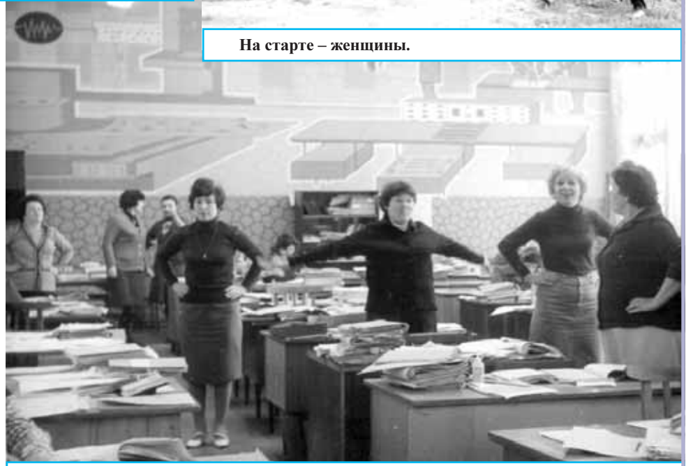
Производственная гимнастика в ОГТ.