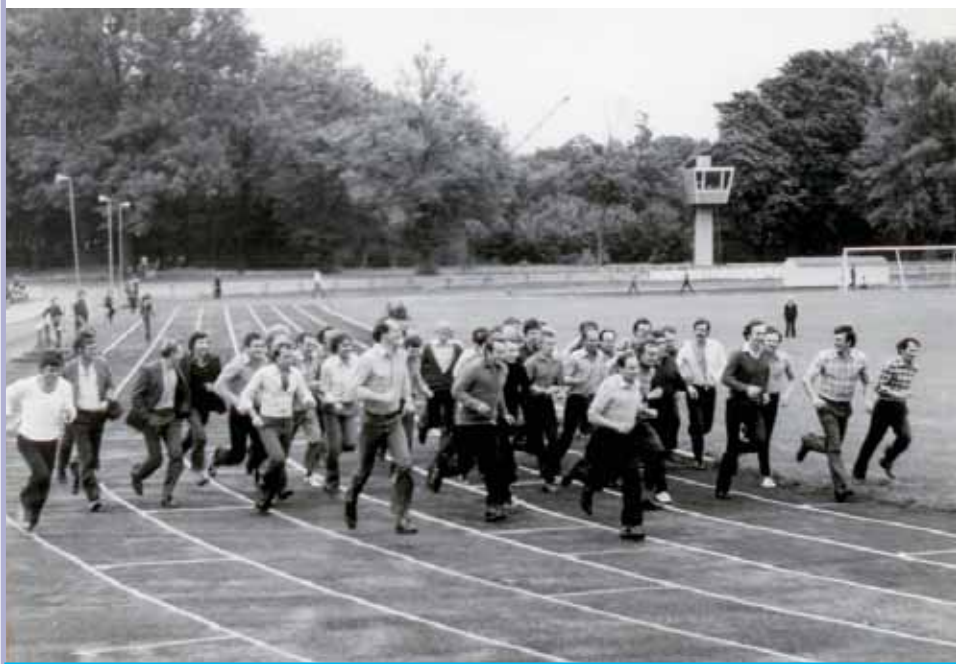
Стадион «Балтика». День бегуна. 80-е годы прошлого столетия.