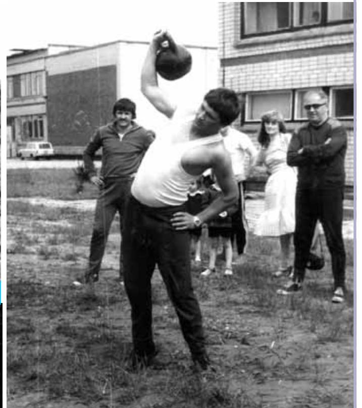
Борьба с гирей (24 кг).