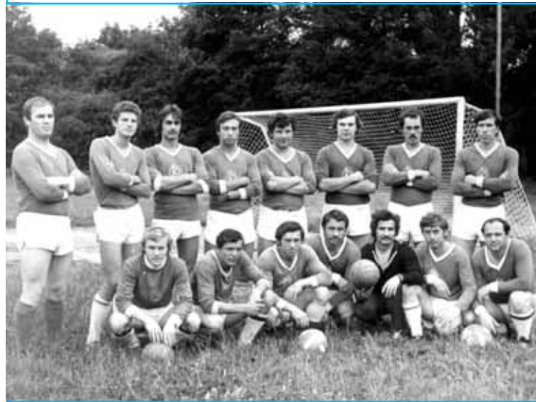
Футбольная команда завода.