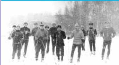
Лыжная гонка в Светлогорске.