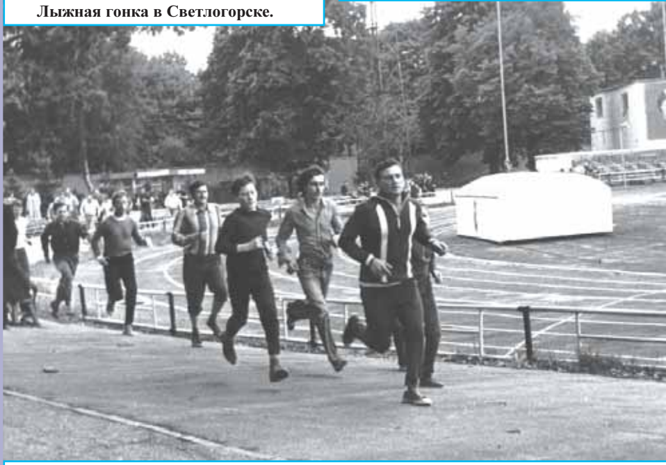
Кросс на День бегуна. Стадион «Балтика».