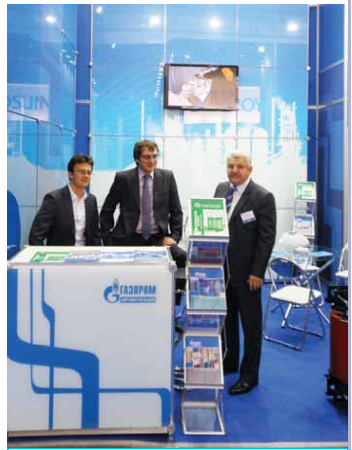
На стенде ОАО «Газпром автоматика».

Завод «Калининградгазавтоматика» вместе с основными крупными предприятиями холдинга, занимающимися производством электрооборудования, презентовал свою продукцию на объединенном стенде ОАО «Газпром автоматика». В основном это были каталоги, в которых представлен практически весь спектр выпускаемой на заводе «Калининградгазавтоматика» электротехнической продукции. Интерес к оборудованию под брендом