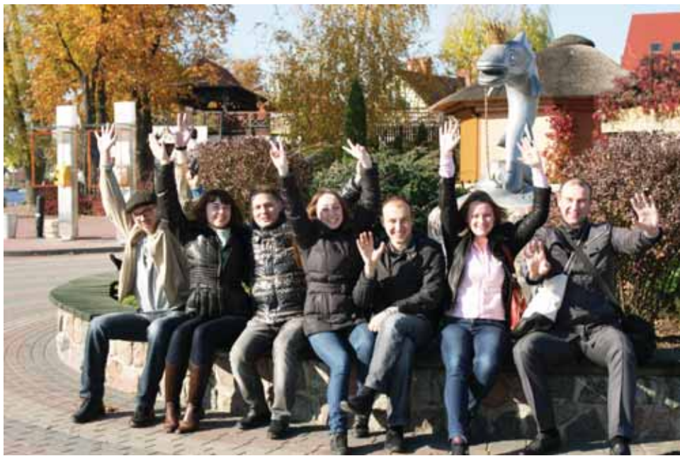
В октябре в качестве награды за успешное выступление на заводской спартакиаде 50 сотрудников КГА провели уик-энд в жемчужине Мазур – польском курортном городке Миколайки.

Словом, на два дня лучшие спортсмены КГА окунулись в атмосферу радости, веселья и активного отдыха. Не испортила