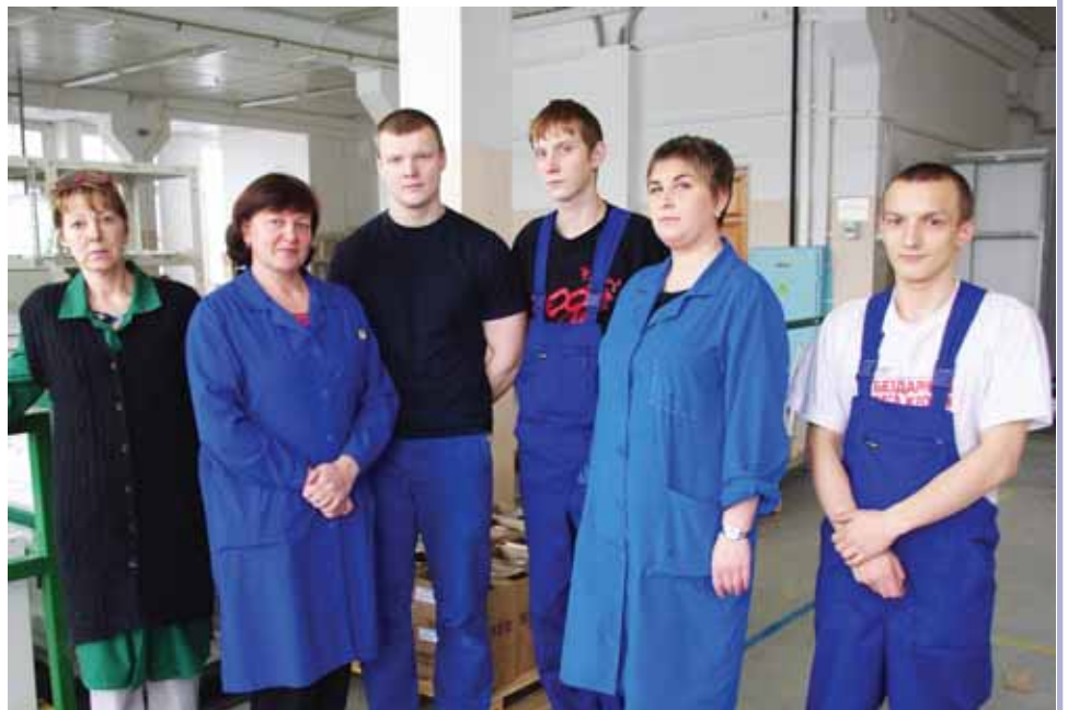
Коллектив бригады монтажников.