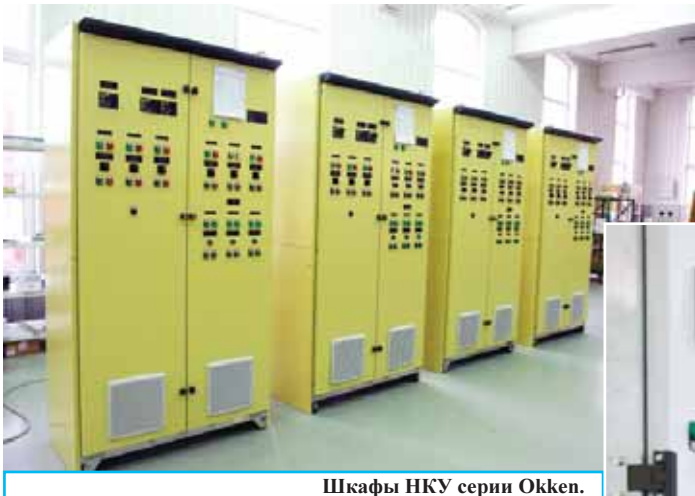
Шафы НКУ серии Okken.

гатительный комбинат «Олений ручей» в Мурманской области, «Иркутскэнерго», Каспийский трубопроводный консорциум, ОАО «Мордовцемент», ОАО «СИБУР».