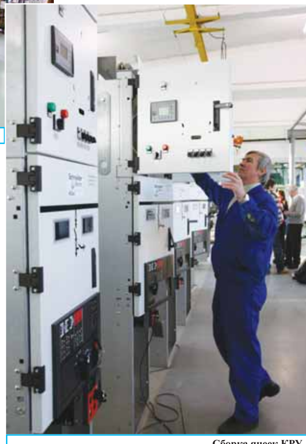
Сборка ячеек КРУ.

- Региональный рынок, несомненно, представляет интерес. Тем более что, по оценке «Янтарьэнерго», полностью изношено и подлежит замене около 60% установленного оборудования, что повторяет аналогичный показатель по отрасли в целом. А с учетом ввода первого и второго энерго-