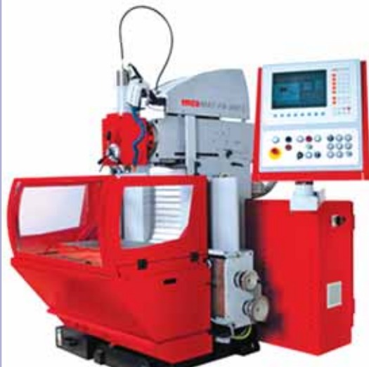
Универсально-фрезерный станок марки EMCOMAT FB-600L