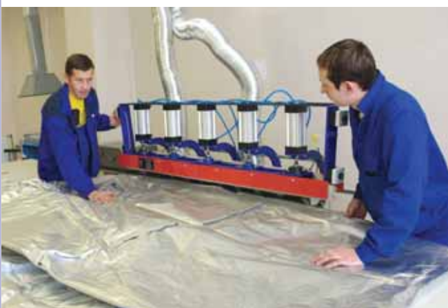
Изготовление чехлов из металлизированной пленки.