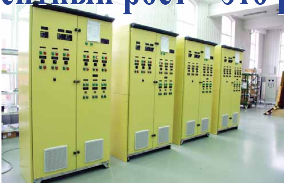
Новая продукция КГА – щиты АВО газа.

- Мы не отступаем от выбранного нами пути. В 2012 году предприятие продолжит решение ранее намеченных задач. Это, прежде всего, автоматизация производства и энергообеспечения. В этом важном для завода направлении у нас уже есть определенные ус-